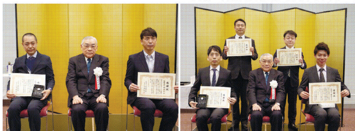
継続して参加している事業所に対して感謝状が授与された