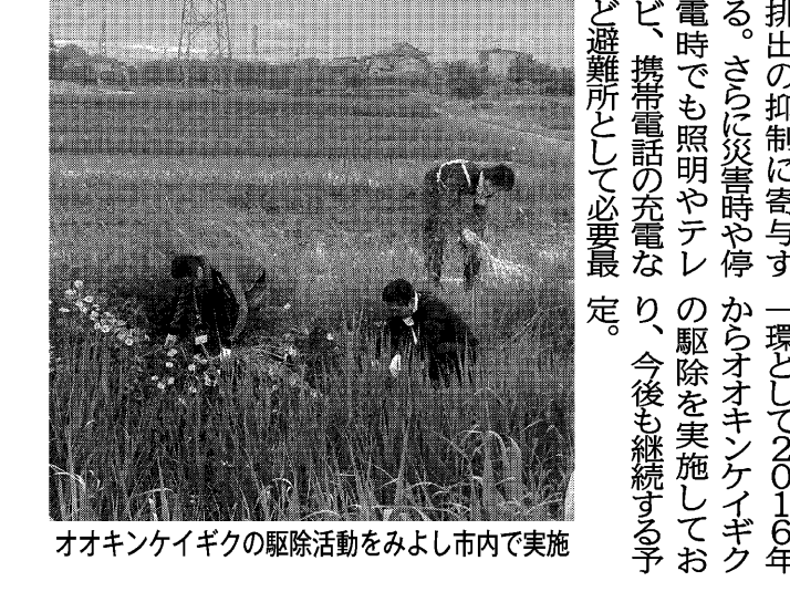
オオキンケイギクの駆除活動をみよし市内で実施

刈谷市の科学館「夢」職員が約200人が参加。約2190ギガのデータを削除した。参加者は手やスコップでオオキンケイギクを抜き取った。土の中は東芝リサイクル(東京都)に根が残っている。再植込が連携し、同施設に生かすため、花に生かす。災害発生や避難所として意識した。黄色い花をつける北米原産のオオキンケイギクは、繁殖力が非常に強く、地域の生態系に重大な影響を及ぼす。三河は社会貢献活動の一環として2016年の排出の抑制に寄与する。さらには災害時や停電時でも照明やテレビの駆除を実施して、携帯充電の充電量も、今後も継続する予定だ。