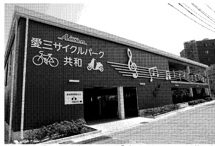
ネーミングライツ9件目となった「愛三サイクルパーク共和」