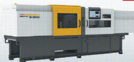
ROBOSHOT SC series