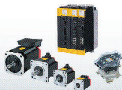
αi-D series SERVO