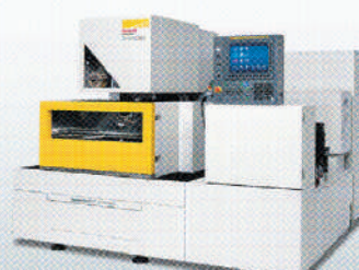
ROBOCUT α-CiC series