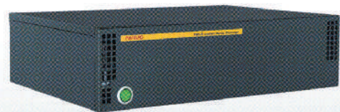
FIELD system Basic Package