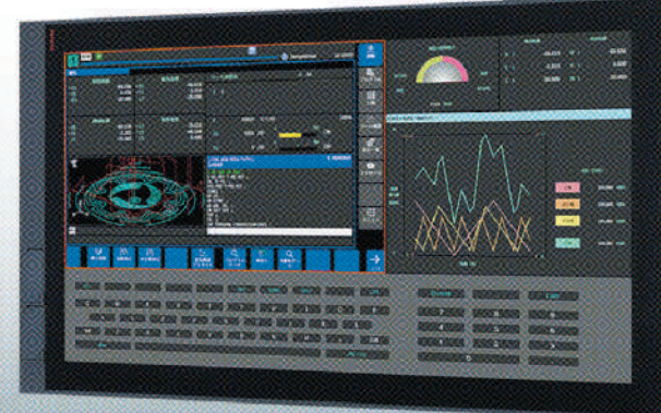
FANUC Series 500i-A