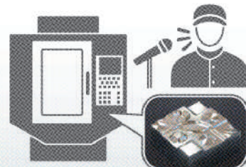
デジタルツインと連携した フィジカルAI