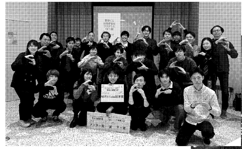
堺市ではスタートアップ支援の取り組みも力強く展開 (さかい新事業創造センター(S-Cube))