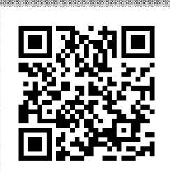
資料請求はこちら