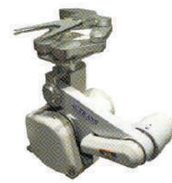
UTM-R3700F 広範囲動作モデル