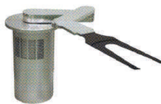
UT-VDX3000 超高真空・高精度モデル