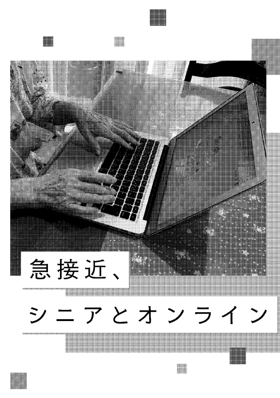
急接近、シニアとオンライン

ニュースイッチは、多彩なジャンルの取材や、業界を横断するオリジナルの企画を通して、幅広い層の人たちにニュースを届けることを目指してスタートしました。多様な視点からテーマを深掘りする特集を少しだけ紹介します。