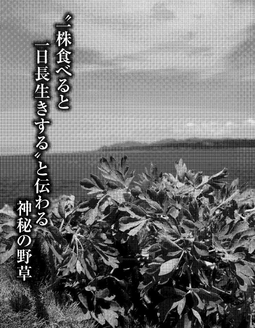
「一株食べる」と一日長生きすると伝わる「長命草」の神秘の野草

日刊工業新聞の読者の皆様にもぜひ実感して欲しい。長寿の島の長命草なら、不安から解放してくれるはずだ。