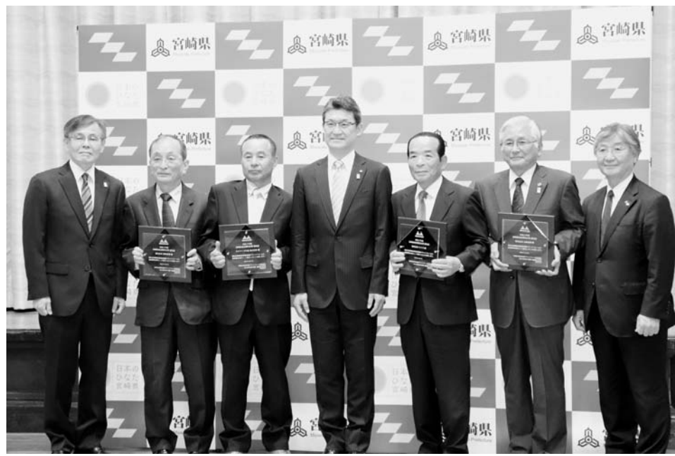
20年度の成長期待企業認定式