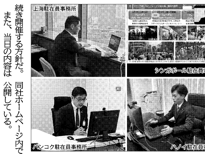
駐在員レポート ライブ配信

十六銀行 十六銀行は6月23日、現地での駐在員レポートを掲載している。駐在員が最新情報をWEB形式で伝えた。ト、中国、シンガポールの3密回避のため、WEL、タイ、ベトナムのB形式で開催(写)。現地の状況や各種政策、経配に78名が参加した。今回は新型コロナウイルス感染拡大による影響、海外への渡航制限などにより海外ビジネスの情報収集が困難な状況下、現地で駐在員が最新情報をWEB形式で伝えた。ト、中国、シンガポールの3密回避のため、WEL、タイ、ベトナムのB形式で開催(写)。現地の状況や各種政策、経配に78名が参加した。今回は新型コロナウイルス感染拡大による影響、海外への渡航制限などにより海外ビジネスの情報収集が困難な状況下、現地で駐在員が最新情報をWEB形式で伝えた。