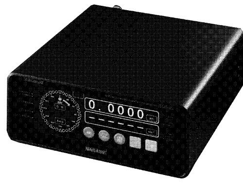
バランススケール

ナガセインテグレーション 3000回転以上にもなる砥石は自動車のタイヤの磨きなどにも使用される。他のマシンの振動も捉え、その測定・調整が用い、ナレーションも