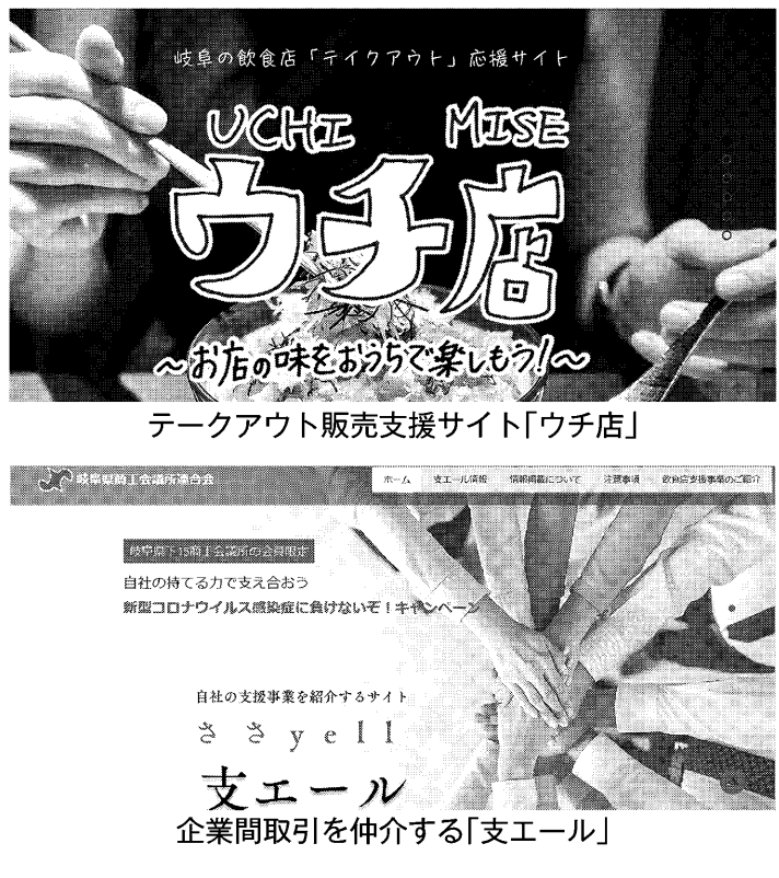
テイクアウト販売支援サイト「ウチ店」

十六銀行 十六銀行は6月23日、現地での駐在員レポートを掲載している。駐在員が最新情報をWEB形式で伝えた。ト、中国、シンガポールの3密回避のため、WEL、タイ、ベトナムのB形式で開催(写)。現地の状況や各種政策、経配に78名が参加した。今回は新型コロナウイルス感染拡大による影響、海外への渡航制限などにより海外ビジネスの情報収集が困難な状況下、現地で駐在員が最新情報をWEB形式で伝えた。ト、中国、シンガポールの3密回避のため、WEL、タイ、ベトナムのB形式で開催(写)。現地の状況や各種政策、経配に78名が参加した。今回は新型コロナウイルス感染拡大による影響、海外への渡航制限などにより海外ビジネスの情報収集が困難な状況下、現地で駐在員が最新情報をWEB形式で伝えた。