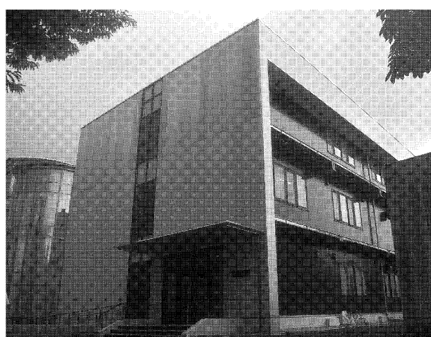
岐阜大学スマート成型開発拠点棟

岐阜大学は成形機が、すると分析可能なデータ不良の予兆を捉えて、自律的に成形や加工条件を最適化する「スマート成型」の研究を進めている。2018年に着手し、事業最終年である2020年に突入した。当初は成形機や金型から採取したデータの分析が重要だと見込んでいたが、実際に着手