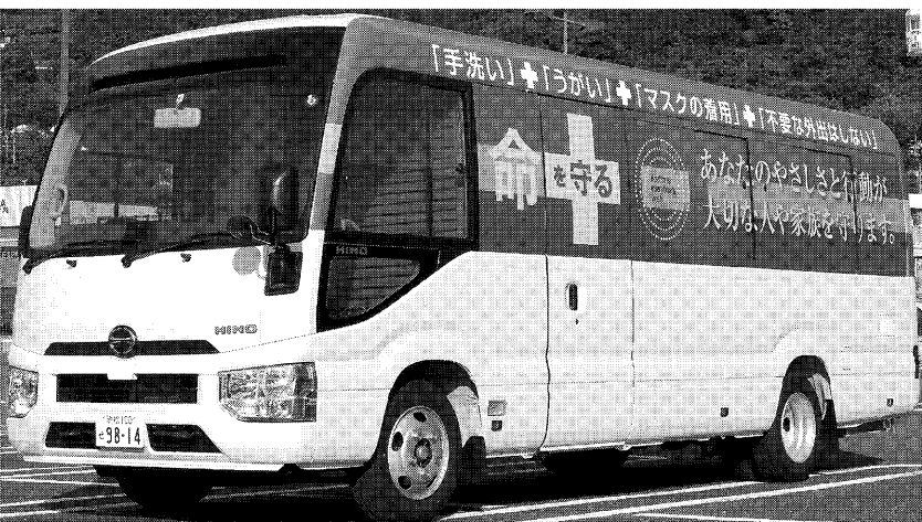
ビッグウェーブHDのPCR検査ができるマイクロバス

車買い取り専門店の運営などを行うビッグウェーブHD(浜松市東区)は、静岡県内外の5社と協力し、車内で水で希釈した殺菌・消毒剤をミスト状に噴射する。検査リステックは、静岡県内外の5社と協力し、車内で水で希釈した殺菌・消毒剤をミスト状に噴射する。検査リステックは、静岡県内外の5社と協力し、車内で水で希釈した殺菌・消毒剤をミスト状に噴射する。 検査リステックは、静岡県内外の5社と協力し、車内で水で希釈した殺菌・消毒剤をミスト状に噴射する。検査リステックは、静岡県内外の5社と協力し、車内で水で希釈した殺菌・消毒剤をミスト状に噴射する。