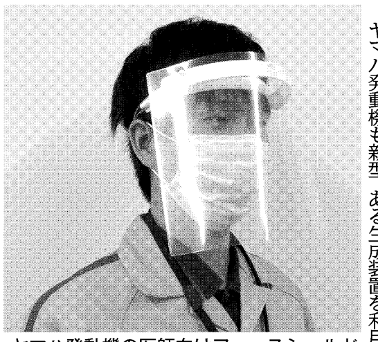
ヤマハ発動機の医師向けフェイスシールド

新型コロナウイルスで不足し、コロナ感染拡大対策のため物資を製造するため、支援として、医療用マスクの生産に力を入れている。ヤマハは新型コロナウイルスにマスクのインテグレーション社、洗浄用の次亜塩素酸水(ハリヤナ州)は、現在生産している。フェリス(ハリヤナ州)は、現在生産している。フェリス(ハリヤナ州)は、現在生産している。フェリス(ハリヤナ州)は、現在生産している。