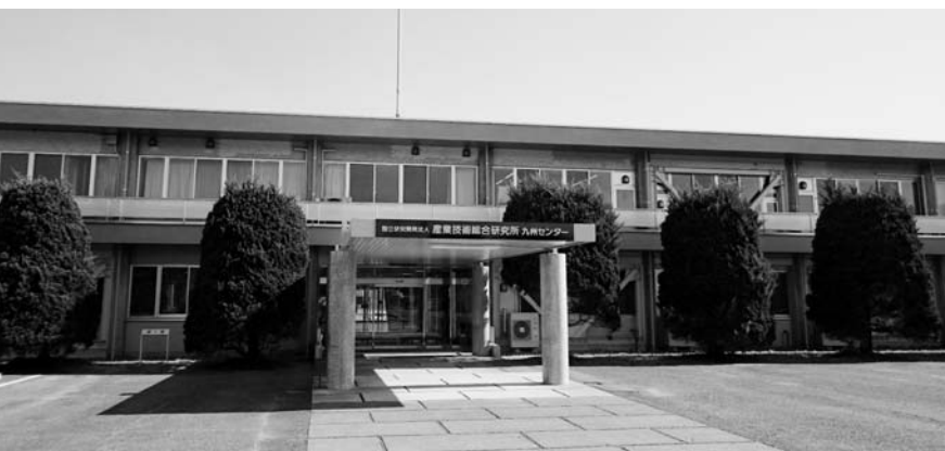
佐賀県鳥栖市を拠点とする産総研九州センター