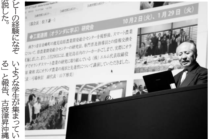
身ものラケットの経験になぞらえて解説した。