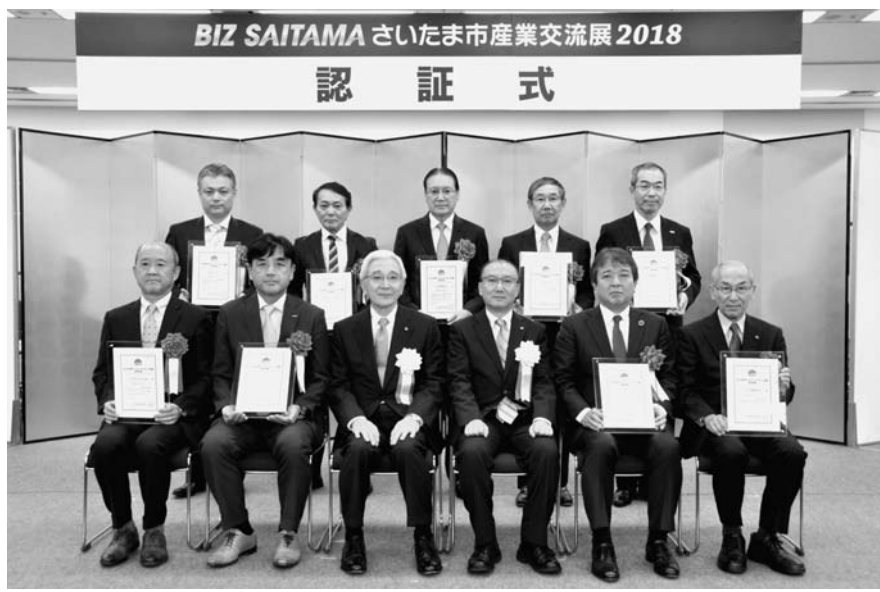
さいたま市リーディングエッジ企業認証式

さいたま市は、2018年度の「さいたま市リーディングエッジ企業」を「リーディングエッジ企業」として認証し、高田製薬(南区)と、企業の国際競争力向上とさいたま市のイノベーション創出を目的として、独自に企画した企業支援を行う。高田製薬(南区)は、リーディングエッジ企業に認定された企業は、国際競争力向上支援などを実施する。認証期間は、認定日から3年経過後の年度末。