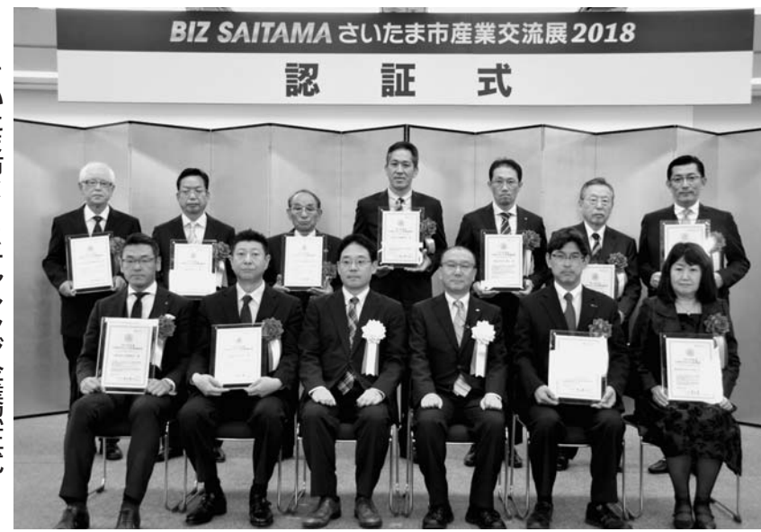
さいたま市CSRチャレンジ企業認証式

さいたま市は2018年度の「さいたま市CSRチャレンジ企業」として11社を認証した。日産自動車(大宮区)、八洲電機(北区)、ウイズユー(北区)、ウイズユーコーポレーション(東区)、富士特殊電気産業(東区)、東亜電子(南区)、タウ(中央区)、協和精工(南区)、友親製作所(南区)、田中務店(浦和区)、渡邊組(桜区)、サット(大宮区)。本年度で7回目の認証となり、同企業は累計9社となった。