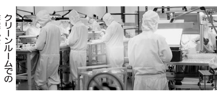
クリーンルームでの作業風景

感性と技能磨き社会的貢献 協和精工は受託加工型企業で、クリーンルームでの精密加工・組立・検査および小型樹脂成形品の製造を手がけている。当社の社風は「人間の感性と技能を磨き社会的貢献を果す」です。1976年の創業以来、「商品を我が娘と考える」お得意先を嫁ぎ先と感ずるほどの思いに立って、そこから真心のこもった製品が生まれてくる」と考え、モノづくりに取り組んでまいりました。FA化、ロボット導入が加速する中でも、微妙な官能による製品の味わいの創出、品質の見極めを担うのは人間の技能と感性です。当社には200人を超す女性(パート含む)が働いており、圧倒的なウーマンパワーでいつも明るく元気で活気あふれています。地元商店街の活動に積極的に関与し、地域社会とのコミュニケーションにも力を注いでいます。今後も人の力が高付加価値製品を生み出すと確信しております。