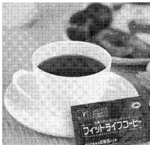
マイルドな味わいの中に秘められたコク、この美味しさでファンを増やしている