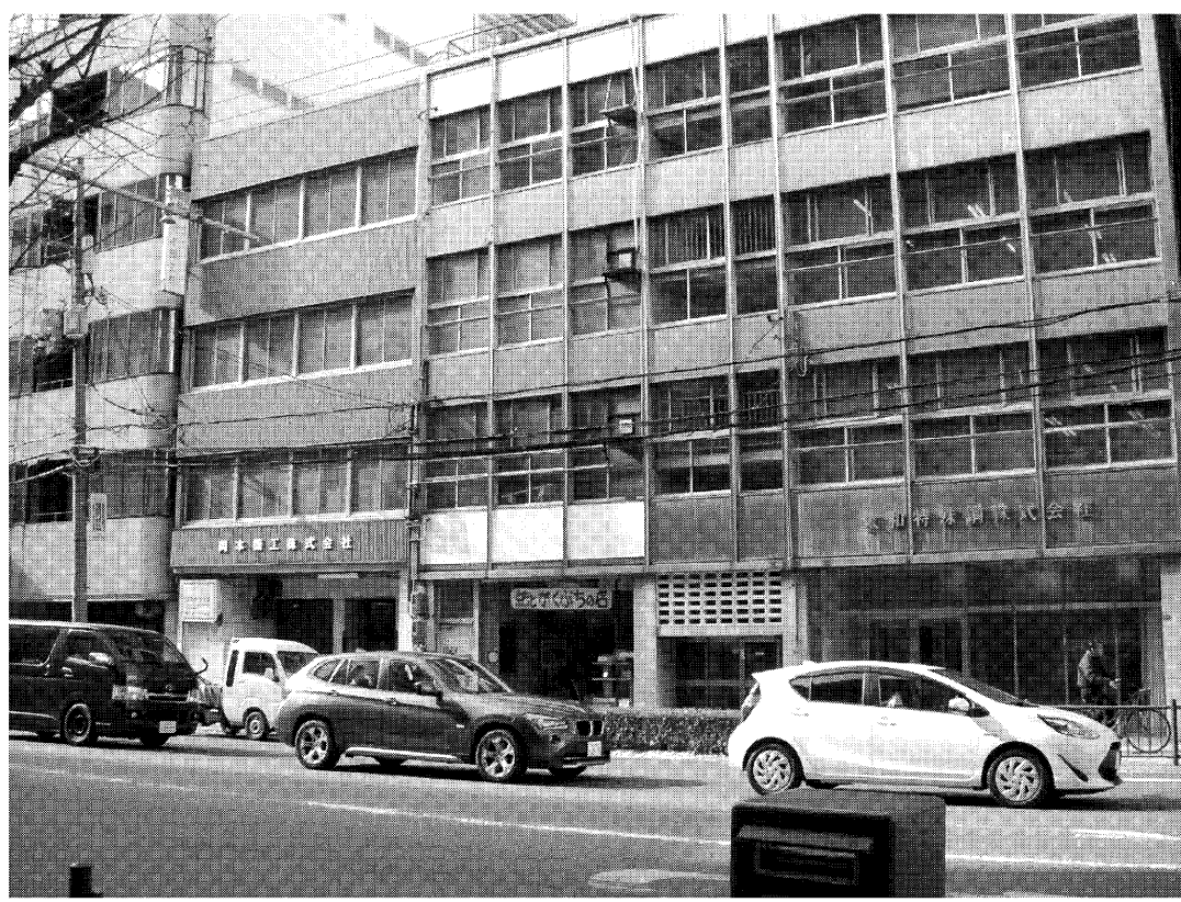
立売堀界隈では活力を取り戻す活動が進められている

立売堀・新町界隈は大阪市西区の一角を占める地域。古くから超硬工具や工作機械、鋼管継手などを取り扱う問屋が集まり、「立売堀に行けば何でもそろふ」といわれるほど活気があふれていた。近年は機械工具の卸や販売に携わる企業が減少。かつてのようににぎわいは見られず、その名を知る機会も少なくなった。以前のような活気を取り戻すべく、大阪西機工会青年部が地域の知名度向上と次世代人材の育成に力を入れている。