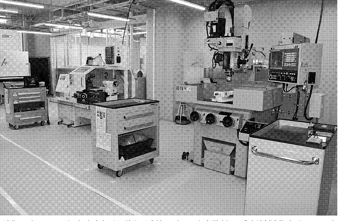
試作スペースのほか、打ち合わせに使える交流スペースも完備(ものづくり創造拠点 SENTAN)

愛知県西三河地区は、自動車産業の一大拠点である。同地区には、安城市、岡崎市、刈谷市、高浜市、知立市、豊田市、西尾市、碧南市、みよし市、幸田町の9市1町で構成される。モノづくりが盛んなこと、また、同地区には、企業間の連携が図られ、試作開発や人材育成を支援する施設が充実している。同地区は、こうした企業の試作開発や人材育成を支援する施設が充実、地域全体でモノづくりを後押ししている。