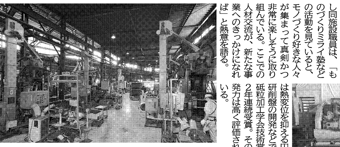
工場内は中子を製造するシェルマシンが並ぶ(クロタ精工)

17年9月17日には、モノづくりの総合支援施設「ものづくり創造拠点 SENTAN」がオープンした。同施設は、試作開発や人材育成を支援する施設が充実している。同地区は、こうした企業の試作開発や人材育成を支援する施設が充実、地域全体でモノづくりを後押ししている。