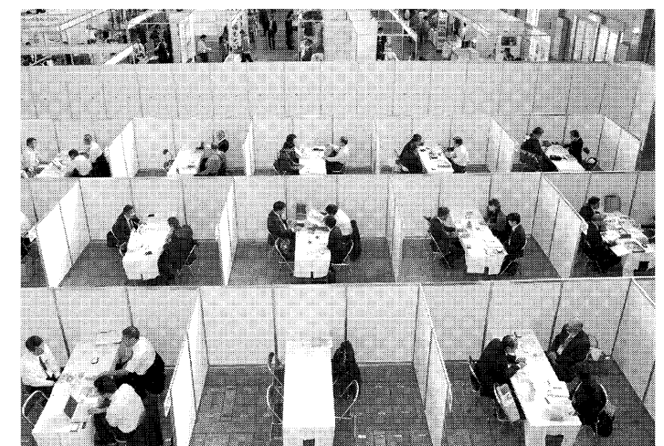
幅広い業種の企業が参加する「特別商談会」

との交流が活発になっていくことがあげられる。信越地域はもちろんのこと、富山駅から埼玉県の大宮駅まで1時間30分と近くなったことから、関東からの来場者も見込まれる。 展示会を通して交流人口が拡大し、ビジネスも地域を越えて大きく展開する。そうした、出展者と信用金庫の持つネットワークの可能性を感じられる場になるだろう。