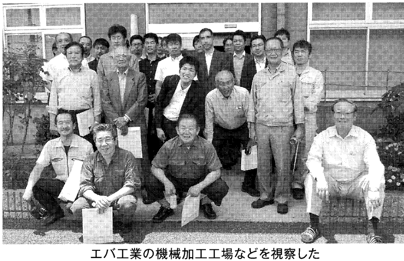
工大工業の機械加工工場などを視察した

20日は越前大仏や永平寺、丸岡城などを散策した。夏季交流会は毎年恒例行事で、17年は8月4日に名古屋駅周辺のホテルで開催した。20日は越前大仏や永平寺、丸岡城などを散策した。