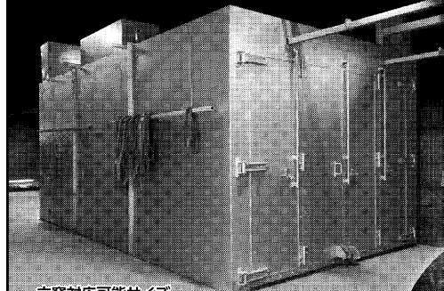
立窯対応可能サイズ 6000mm×2800mm×2500mm