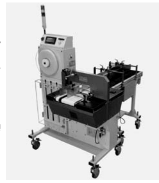
テーピングマシン「WAS」 —2500—300—C>—