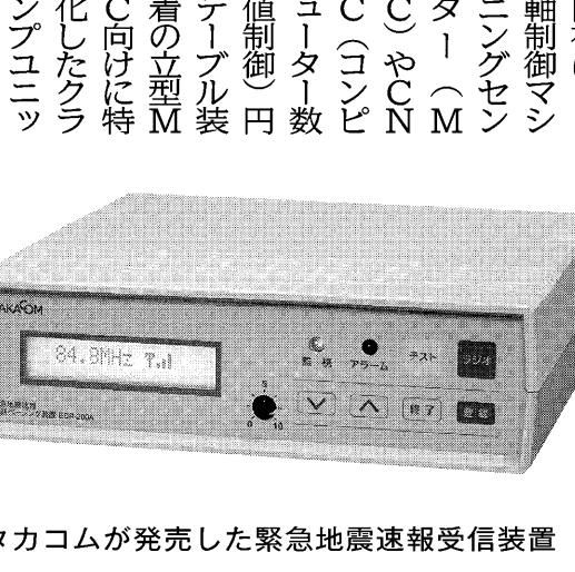
タカコムが発売した緊急地震速報受信装置

心が常に同じ場所にある。口金の可動幅はツメ仕様で8.5mm(10mm)まで。テスト放電機を搭載しており、送電機も使用できる。より便利に、もっと快適に。岐阜の企業の挑戦は続く。