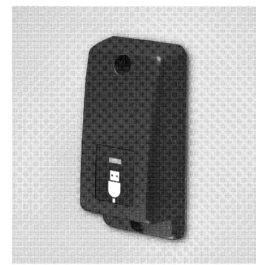
路線バス用USB充電器(レシップホールディングス)

トノカバー(トノカバー) 岐阜プラスチック工業を開発した。2月にトヨ自動車が発売した「材ニテセル」を用いたトノカバーが、高剛性を保ちながら、軽量化に成功。製品「トノカバー」は林テレンプがトヨタ(岐阜県関市)に供給する。