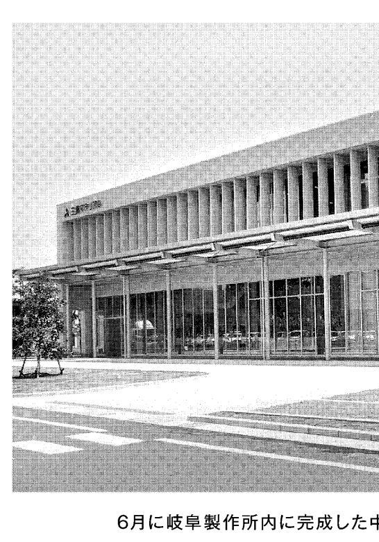
6月に岐阜製作所内に完成した中部テクニカルセンター(三菱マテリアル)

町内に切削工具の技や西日本の顧客へのソリューション提供力をした。ここでは基礎から「テクニカルセンター」高めるのが狙いだ。新加工設備や測定・分選装置はさいたま「切削アカデミー」を