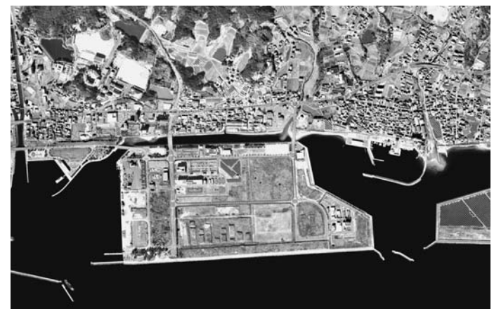
淡路津名地区の生穂。公共岸壁、淡路市役所、市の防災拠点、メガソーラーなどが立地している

兵庫県の活性化につながる企業立地の動向は関心を集める。兵庫県が経済産業省の工場立地動向調査をもとにまとめた2016年の県内工場立地動向は、立地件数が56件(15年73件)、立地面積が51.4万㎡(15年60.6万㎡)と15年実績に比べ減ったものの、立地件数の都道府県別順位は全国3位となるなど上位をキープした。陸・海・空の充実した交通網による優れた立地に加え、最先端の研究施設が複数あるなど環境も人気の理由となった。