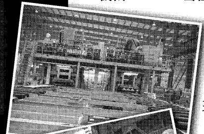
自社製品 船舶用ライン

機械メーカーの当社は中国内で自社機械製品を数多く生産しております。 メーカーとしての機能と中国製作の実践ノウハウで Q(品質)・C(コスト)・D(納期)について 御満足いただける部品調達及び完成品の 委託製作を承っております。