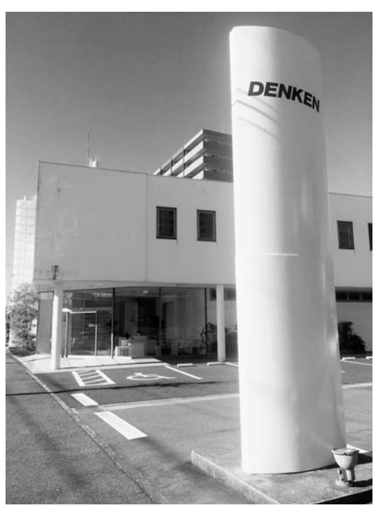
デンケンは関東と中部での営業を強化する