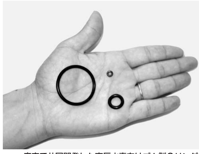
産官で共同開発した高圧水素向けゴム製Oリング

産官で共同開発した高圧水素向けゴム製Oリング。製品や摩耗が少ない製品の開発も行い、用途を広げる。