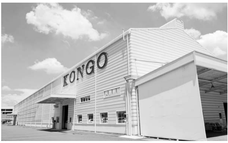
金剛は熊本地震の復興に向け第2工場を建設する