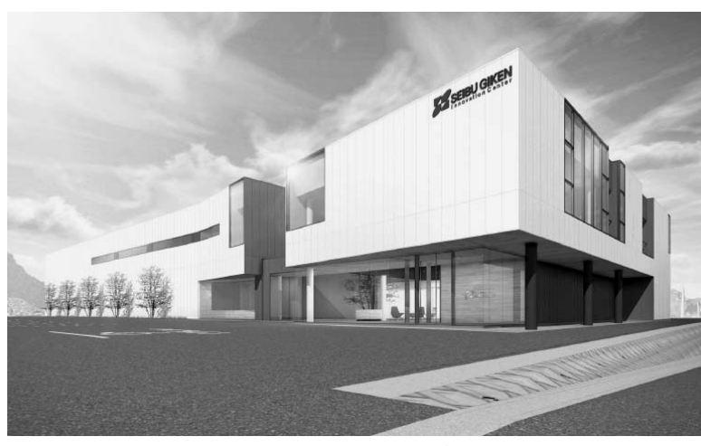
西部技研が建設する研究開発拠点の完成予想図