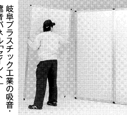
岐阜プラスチック工業の吸音パネル「セイント」

ナガセインテグレックスの微細形状加工機「NIC-300a」。高精度の6軸同時直角に加工でき、最小切削分解能は100万分の1度。位置再現性は、2.7ナノメートル。