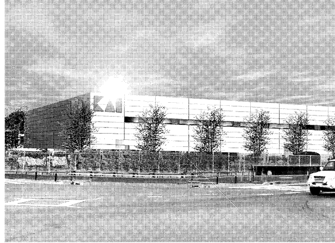
カインダストリーズの新工場棟(完成イメージ図)

培った技術を生かす。開市の刃物工場を再編。生産能力を現状比2倍のし、新たな設備投資を。投資額は1億4000万円に達する。さらには19年春まで行っていく大型投資に踏み出す。国内で約30億円の大型投資。さらには19年春まで行っていく大型投資。さらには19年春まで行っていく大型投資。