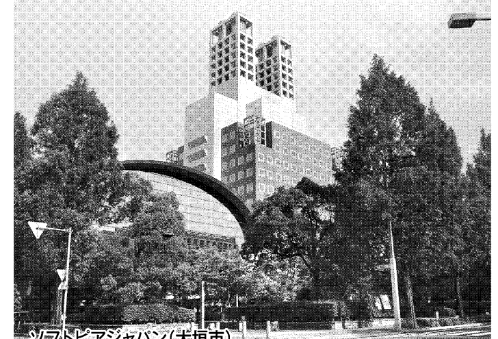
ソフトピアジャパン(大垣市)