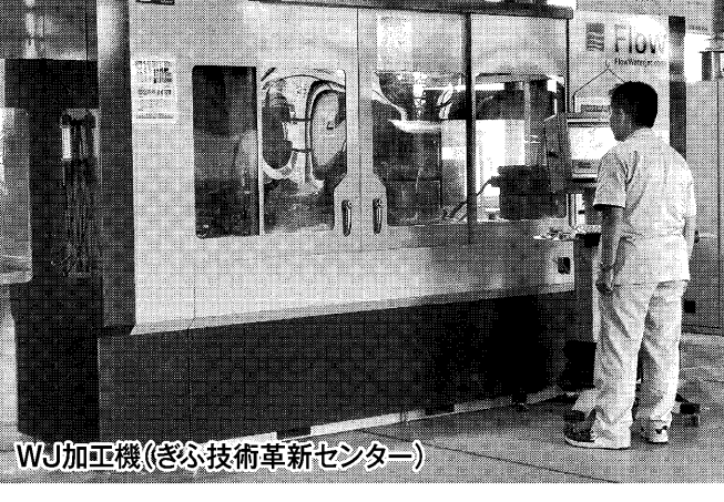
WJ加工機(さき技術革新センター)