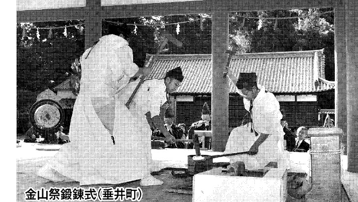
金山祭鍛錬式(垂井町)