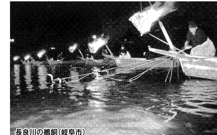
長良川の鸕飼(岐阜市)