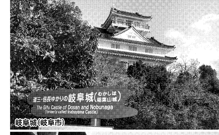
道三・信長ゆかりの岐阜城(おかしは) The Gifu Castle of Dosan and Nobunaga (Formerly called Inabazama Castle)