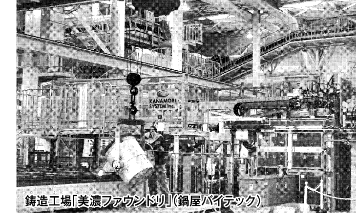
铸造工場「美濃ファウンドリー」(網屋ハイテック)