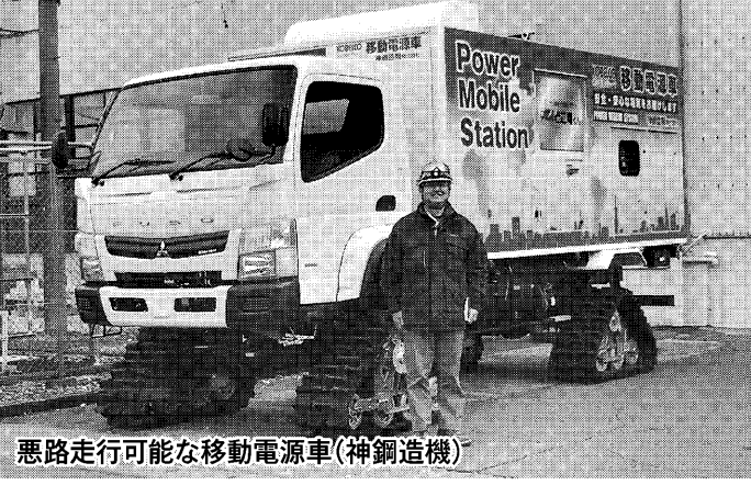
悪路走行可能な移動電源車(神鋼造機)