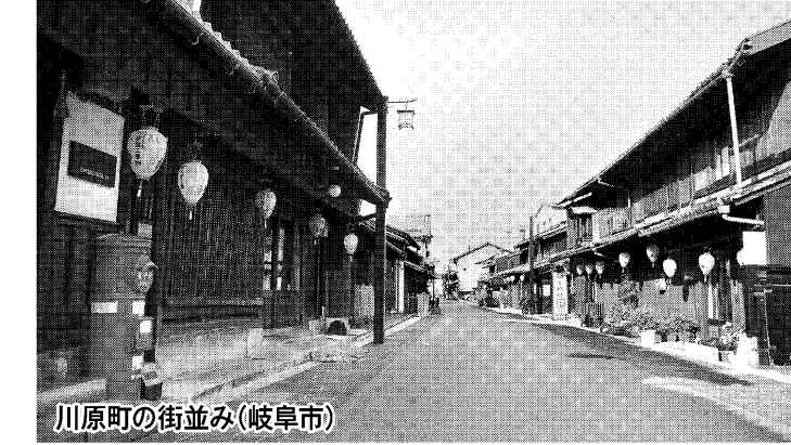
川原町の街並み(岐阜市)