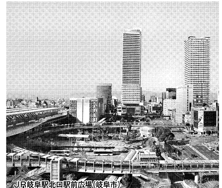
JR岐阜駅北口駅前広場(岐阜市)

産官学協働でスマート金型の 実用化を目指す 岐阜県は「小京都」と称される高山市や白川郷の合掌造り集落、長良川の鸕飼といった観光分野で知られるが、県の産業構造は製造業の割合が県内総生産額の約4分の1を占め、全国と比較しても製造業の割合が高い。従来員数でも全体の約4分の1を製造業が占めている。現在は自動車を中心に輸送機器関連や金属加工業が盛んで、電子部品やデバイス関連企業も活躍する。さらに刃物や陶磁器、木工、繊維関連などの地場産業も活発だ。 自動車業界ではトヨタ自動車系の岐阜車体工業（各務原市）と三菱自動車系のパジェロ製造（坂祝町）の車体メーカーが拠点を構えるほか、太平洋工業や丸順などの部品メーカーが集積。また航空機業界では川崎重工の航空宇宙部門が工場を構える各務原市と、その周辺地域に数多くの協力企業が立地する。県内企業の業績は自動車や航空機関連を中心に、おおむね堅調に推移しており、先を見据えた設備投資や新技術・新製品開発を進める企業も少なくない。 一方で新興国の台頭など、モノづくり企業が直面する問題は厳しさを増している。県は技術基盤を生かすべく、企業の成長分野への展開を支援するほか、IoT（モノのインターネット）導入やモノづくりスマート化の研究開発を推進し進める。17年度にはIoT導入に向けた支援で、産官共同の実証事業を展開するほか、導入促進補助金を設ける予定。またIoT設備対象の低利貸付枠も創設する見込みだ。さまざまなメニューを用意し、企業の成長を後押しする。