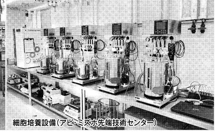
細胞培養設備(アピコム先端技術センター)