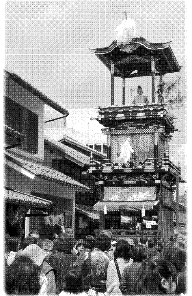
犬山祭(愛知県犬山市)

岐阜県飛騨市の「古川祭」、愛知県犬山市の「犬山祭」を含む18府県33件の「山・鉾・屋台行事」が2016年12月に「ユネスコ無形文化遺産」に登録された。