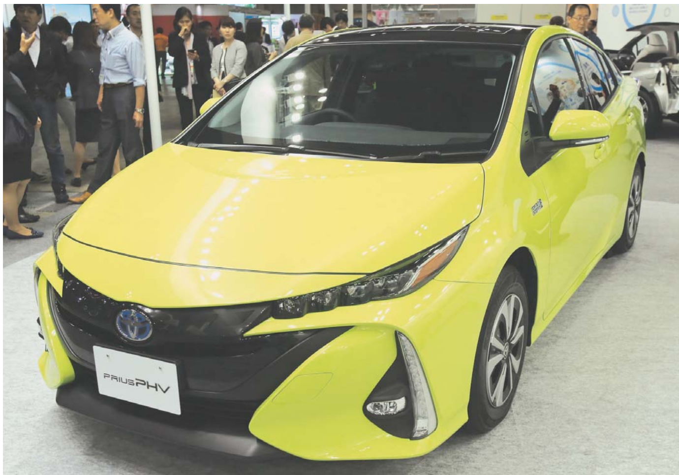
トヨタが今冬発売を予定する新型プラグインハイブリッド車「プリウスPHV」

モノづくりのメッカとして日本の産業界をリードする愛知県。トヨタ自動車はプラグインハイブリッド車「プリウスPHV」や燃料電池車「ミライ」の事業化で業界の技術革新をけん引し、自動走行や「つながるクルマ」の研究開発も加速している。航空機業界は存在感を高め、国産初の小型ジェット旅客機「MRJ」 の開発も進む。またJR東海は2027年にリニア中央新幹線を開業し、高速鉄道の未来像を世に示す。工作機械各社はIoT(モノのインターネット)や新加工法を活用するモノづくりの革新を提案する。さらに愛知の企業は海外展開にも意欲的だ。愛知のモノづくりは世界に大きなインパクトを与えている。