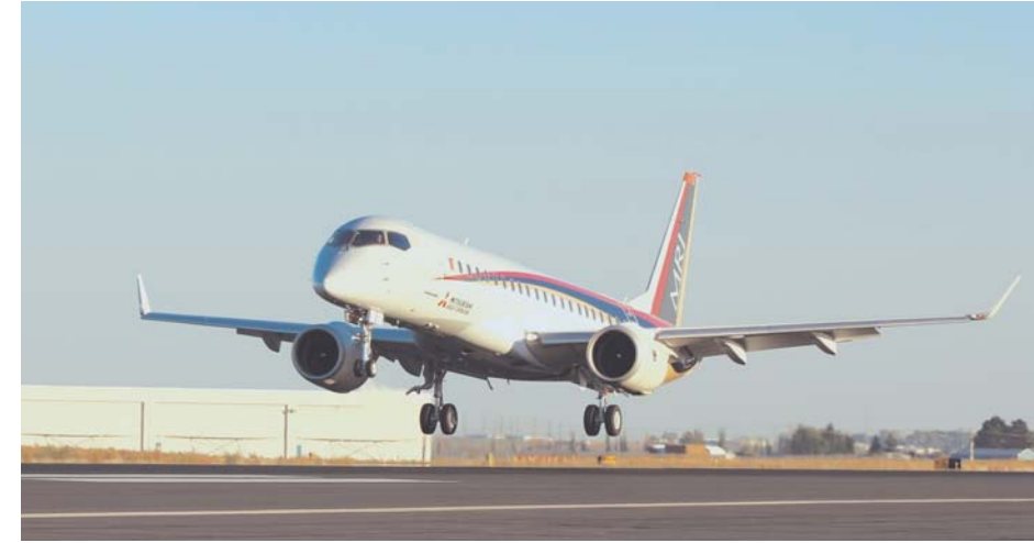
米国での試験飛行に挑む小型ジェット旅客機「MRJ」