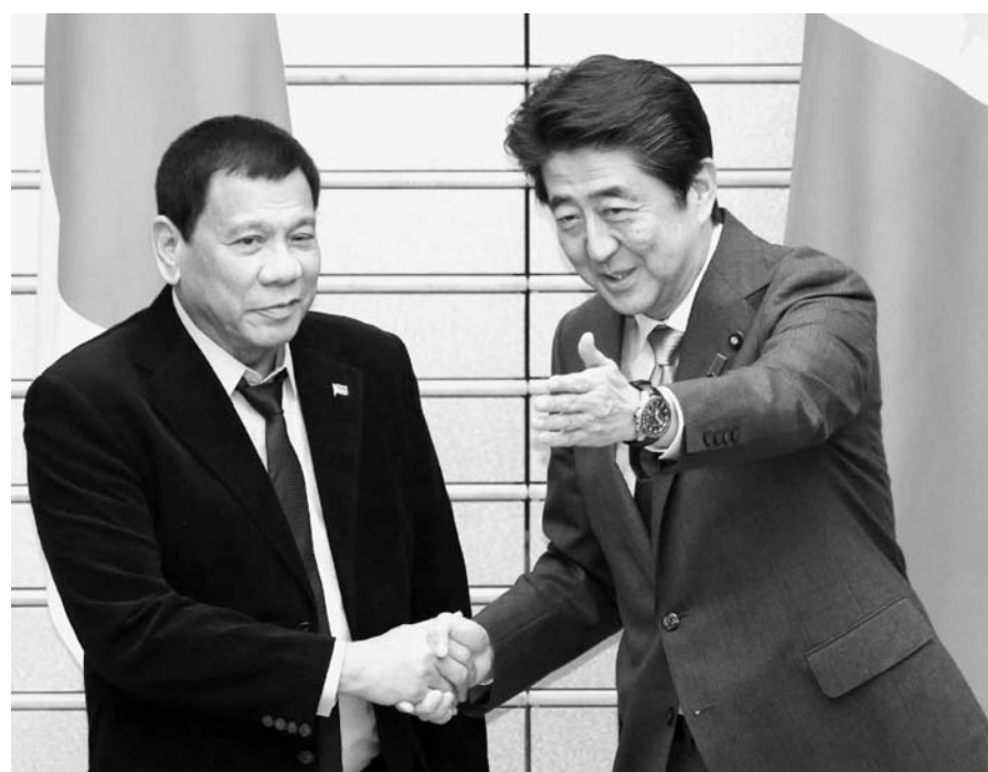
共同記者発表を終え、フィリピン人のドゥテルテ大統領(左)へ歩み寄る安倍晋三首相(26日夜、首相官邸)時事

10月20日(木) □ タイに「イカ天」新工場 マルエス/世界に輸出 マルエスは、つまみのイカフライ(イカ天)工場をタイに新設する。タイに輸出しているイカ天を、現地生産に切り替える。将来はタイから東南アジアをはじめ、世界に出荷。(15面) 10月21日(金) □ インドネシアでアンモニア 三菱ガス化学/年70万ト 三菱ガス化学は、インドネシアでアンモニア製造事業に参画する。現地資本との合弁会社が手がける。アンモニアの年産能力が70万トで、2017年末に稼働する予定。(13面) 10月22日(土) □ スズ鉱山、枯渇の可能性 ミャンマー/マンモア鉱山 ミャンマーは、マンモア鉱山のスズ生産が大幅に減少しており、鉱床が「2-3年で」枯渇する可能性。世界3位の生産国に浮上。スズの大半はマンモア鉱山で生産。(時事=15面)