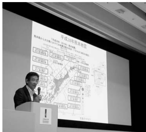
7月22日、工学院大学(東京)で行われた報告会

「熊本の被災状況把握と対応」の報告会が、工学院大学(東京)で行われた。報告者は、熊本の被災状況を詳しく説明し、歴史的建造物の保護の重要性を述べた。また、熊本の被災状況を詳しく説明し、歴史的建造物の保護の重要性を述べた。