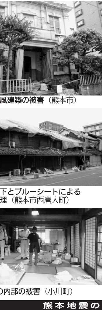
木造洋風建築の被害(熊本市) 瓦の落下とブルーシートによる応急修理(熊本市西唐人町) 商家の内部の被害(小川町) 熊本地震の

被災状況把握と対応 被災状況把握と対応の重要性を述べた。熊本の被災状況を詳しく説明し、歴史的建造物の保護の重要性を述べた。