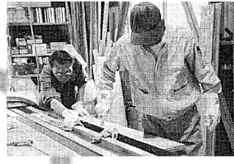
STAFF 技術が光る人材育成