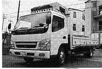
DELIVERY テリバリー即納システム