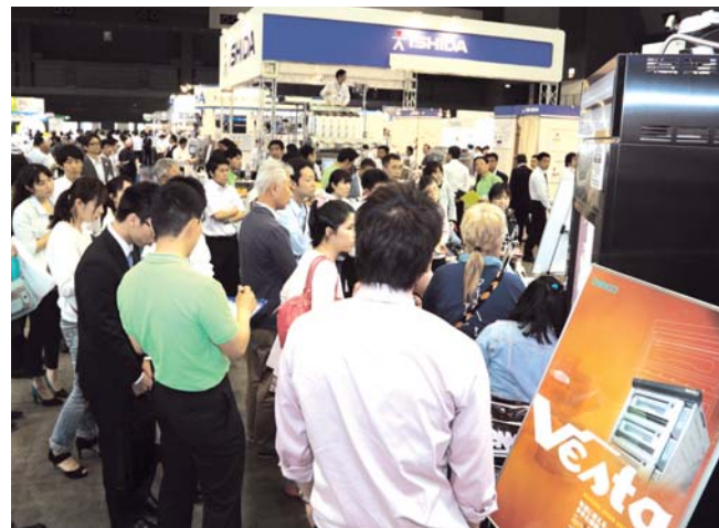
出展企業の実演には多くの人が集まる