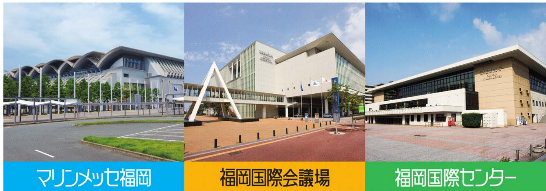
マリノメッセ福岡