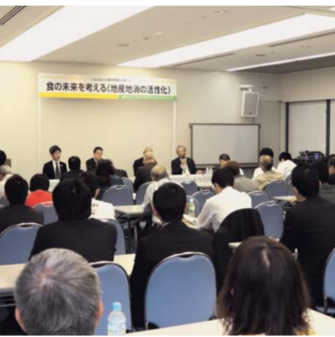
さまざまなテーマでセミナーを開催

会場内に10カ所あるイベントコーナーでは、業界団体主催によるコンテストや講習会、実演などが連日開かれる。コンテストは3日間、五つの団体がそれぞれ開催する。18日は福岡県洋菓子協会が九州洋菓子実技コンテスト福岡大会、福岡県洋菓子技術コンテスト大会を開催する。デコレーションケーキ、エッセイなど10以上の部門がある大規模なコンテストを実施する。いすも19日に入賞者を表彰し、作品は