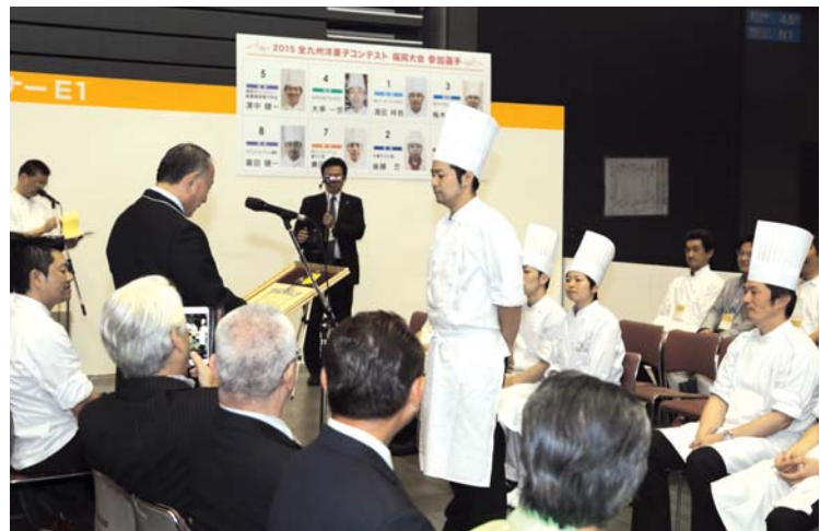
コンテストの表彰式も開催

会場内に10カ所あるイベントコーナーでは、業界団体主催によるコンテストや講習会、実演などが連日開かれる。コンテストは3日間、五つの団体がそれぞれ開催する。18日は福岡県洋菓子協会が九州洋菓子実技コンテスト福岡大会、福岡県洋菓子技術コンテスト大会を開催する。デコレーションケーキ、エッセイなど10以上の部門がある大規模なコンテストを実施する。いすも19日に入賞者を表彰し、作品は