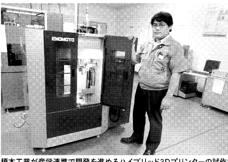
複合工業が産学連携で開発を進めるハイブリッド3Dプリンターの試作機

北区。静岡文化芸術大学と産学連携で、5軸制御のマシニングセンター(MC)と樹脂積層機能を融合した国内初の「ハイブリッド3Dプリンター」の試作機を完成した。