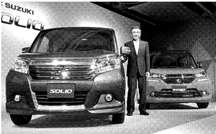
スズキは新中計で小型車強化を掲げる(新型「ソリオ」を発表する鈴木俊宏社長)

ヤマハ発動機は1月の新中期3カ年経営計画をスタートさせた。「新しい成長戦略に挑戦する」。