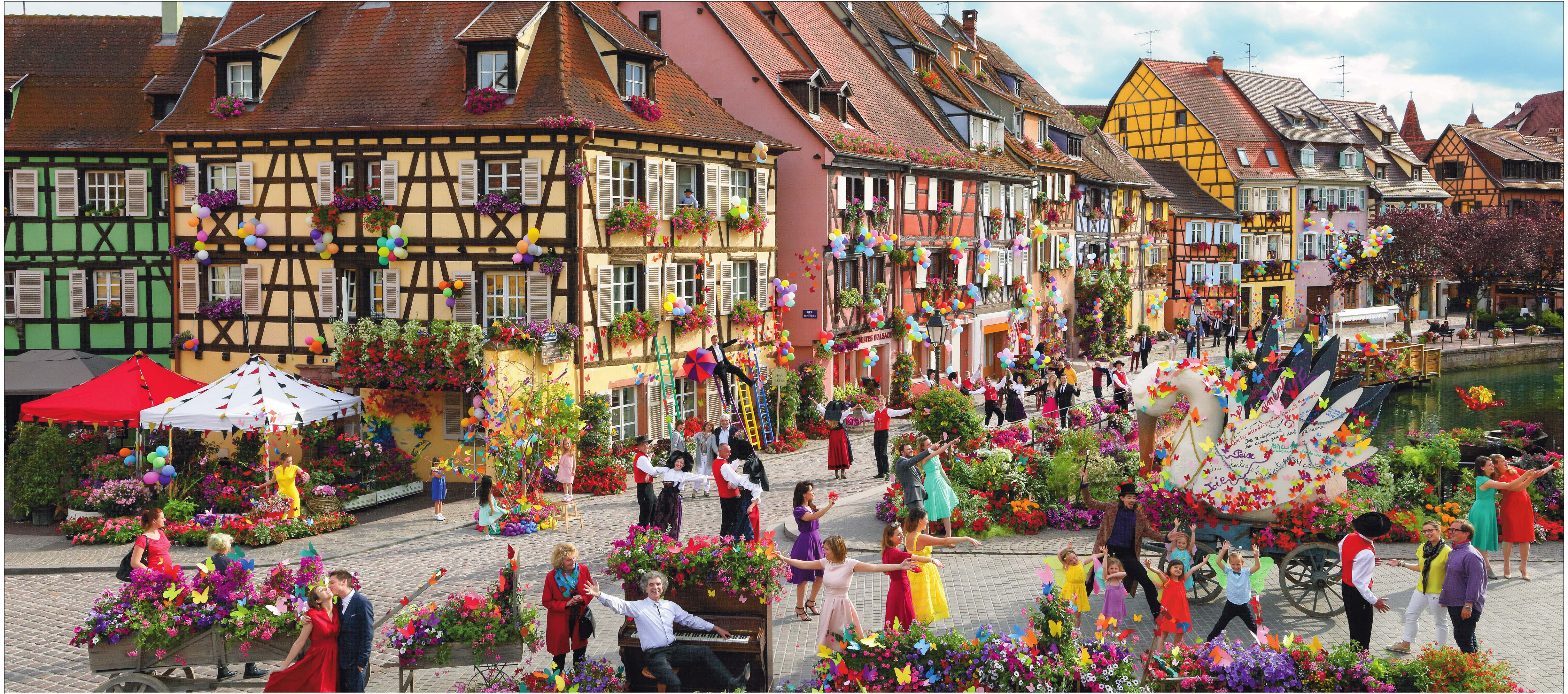
撮影地：フランス コルマル