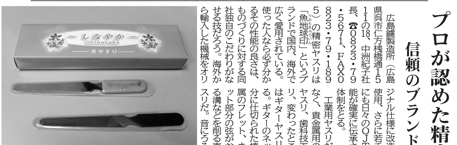
絹織物などの商品の扱いに、爪に気を使う プロ職人から支持される「爪やすり」