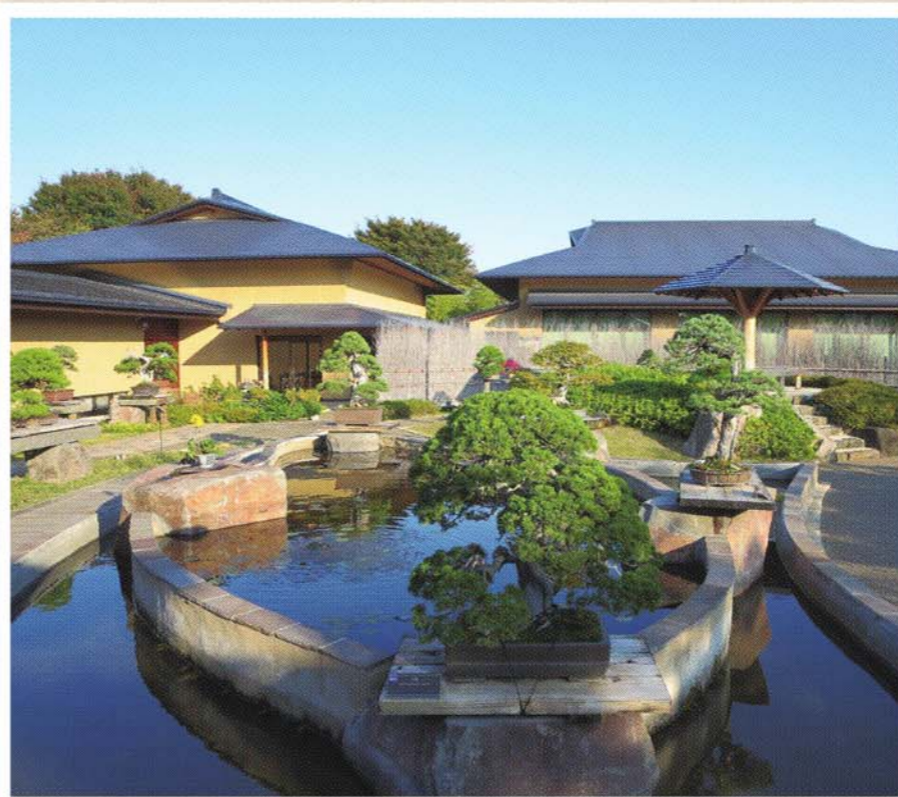
▲大宮盆栽 第1回世界盆栽大会の開催地は大宮市(現さいたま市)だった