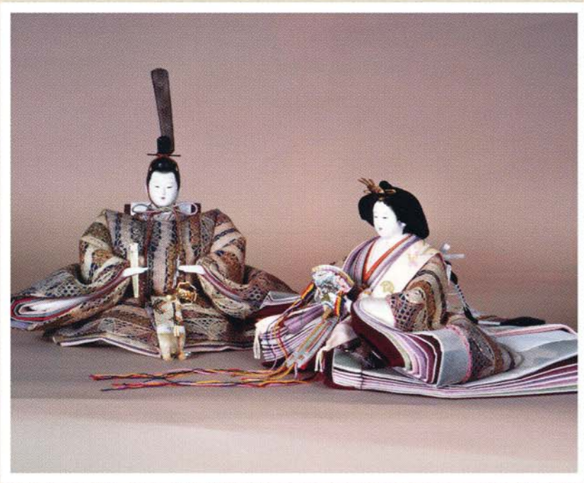
▲岩槻人形 岩槻では特に頭の製作が盛ん