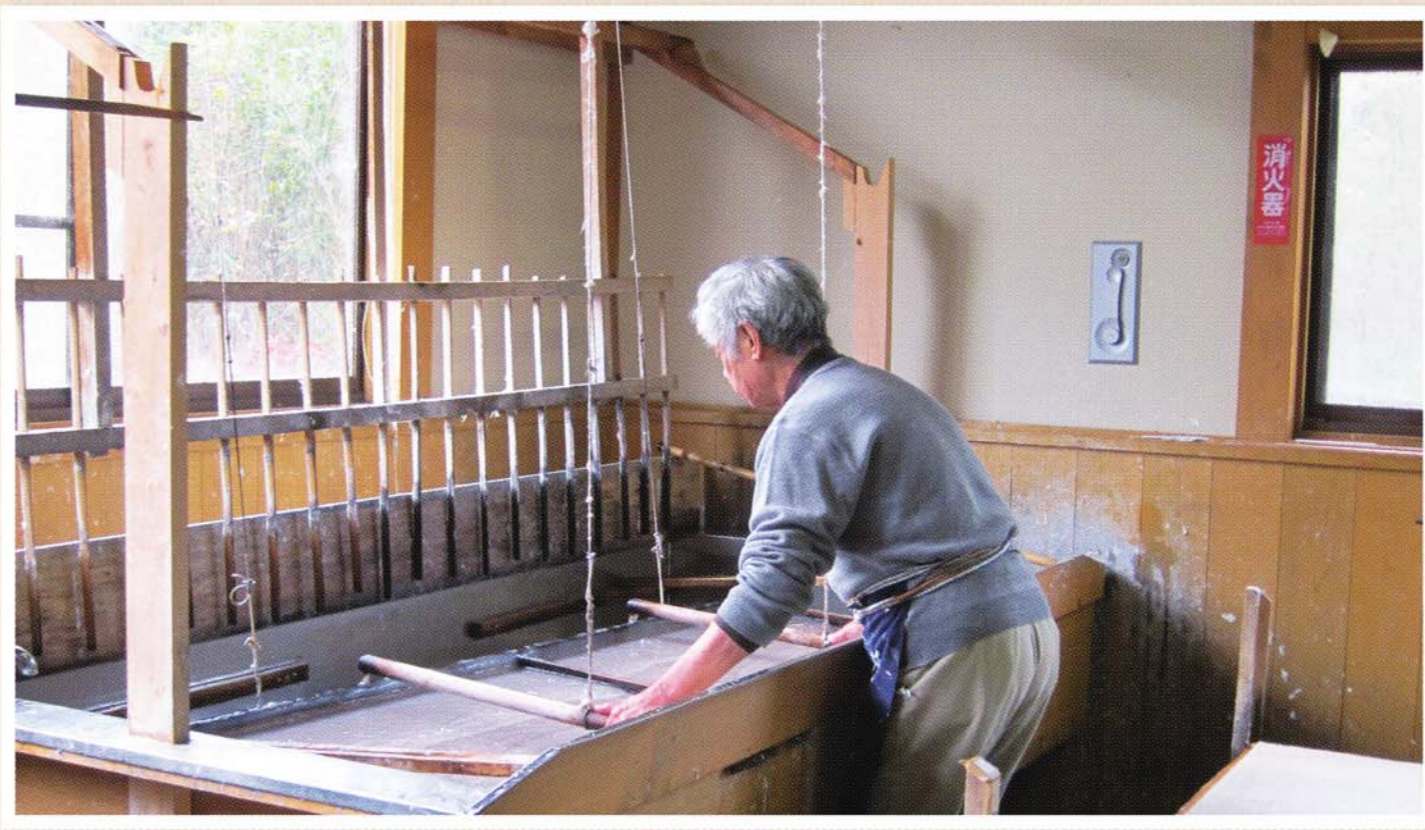
▲細川紙 手すきの技術は国の重要無形文化財に指定されている