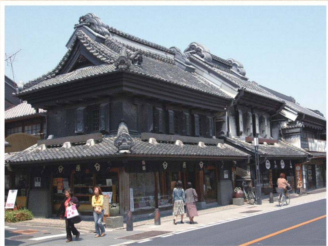
▲川越・蔵造りの町並み 1893年(明治26年)の大火災をきっかけに広まった耐火建築

昨年11月に国連教育科学文化機関(UNESCO)無形文化遺産への登録が決まった細川紙をはじめ、2017年の「第8回世界盆栽大会 in さいたま」開催が決まり注目が集まる大宮盆栽や、岩槻人形、行田足袋などの工芸品、蔵造りで知られる川越の町並みを写真とともに紹介する。この企画を通し、埼玉の伝統と文化を振り返る。