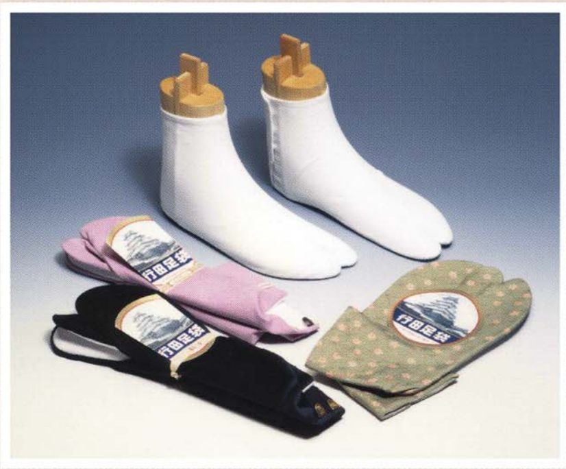
▲行田足袋 1938年(昭和13年)には8400万足の生産を誇った