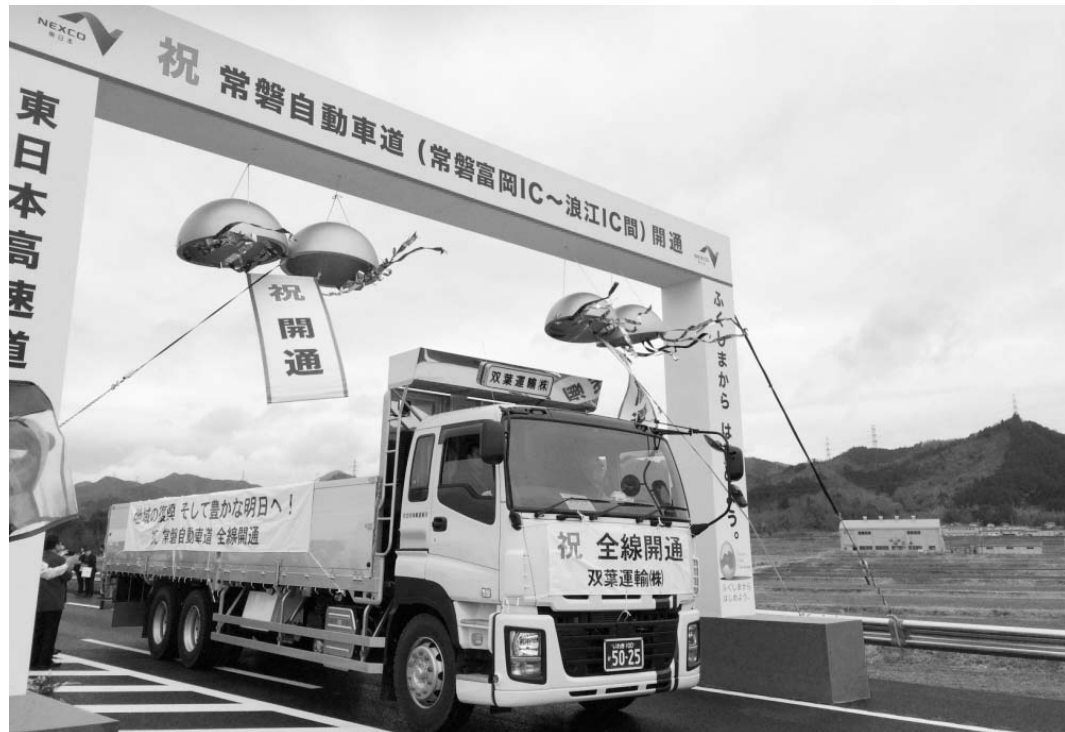
復興に向けて大きく前進。3月1日、常磐自動車道が全線開通した