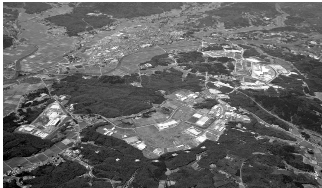
宮城県内最大規模を誇る仙台北部中核工業団地群