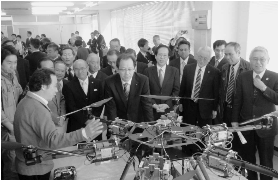
3月13日、福島県南相馬市の菊池製作所南相馬工場で開かれた災害対策ロボットの成果発表

東日本大震災から4年が過ぎた。3月、首都圏と東北地方を結ぶ常磐自動車道が全線開通。JR仙石線も5月30日に全線で運転を再開する。業績が震災前の水準に近づく企業が増える。沿岸部では震災前の水準を超える企業もある。沿岸部では