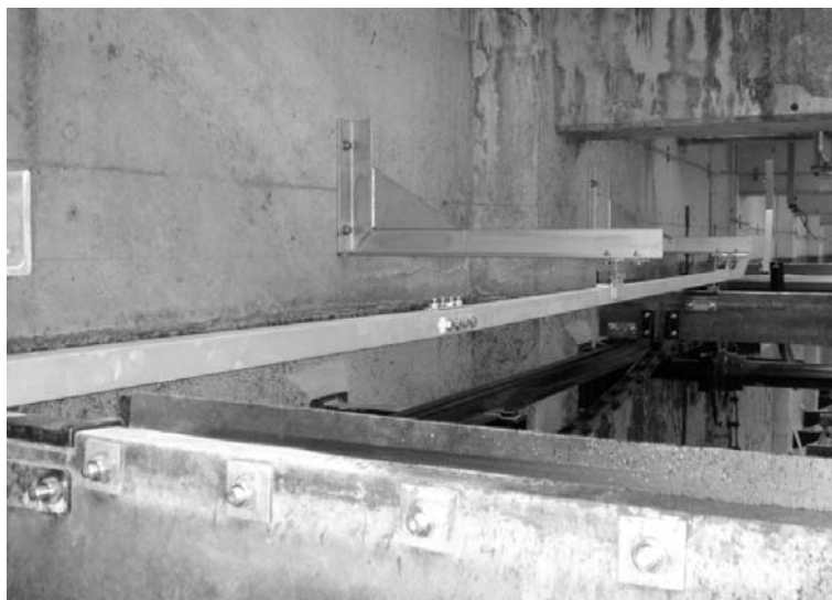
汚泥掻き機の脱輪抑制装置は高い評価を得た

競合もあつたが溶接なしで後付けでき、各種メーカーの装置に比べ、修理・交換も容易という汎用性が評価された。「さまざまな経験を設計に盛り込めた」と、この成功は社内にも自信を