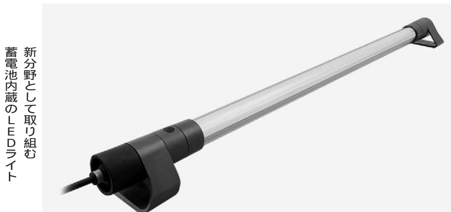
新分野として取り組む蓄電池内蔵のLEDライト

三協を意味する「TRIEN」と「CONSENCIO」の語源から、これに「常」を添えて「常業」という意味を込めた。このブランドの持つ意味や理念を記した「ブランドブック」を作成して、全社員に配布し、一人ひとりが何を考え、どう行動すべきかの指針としている。