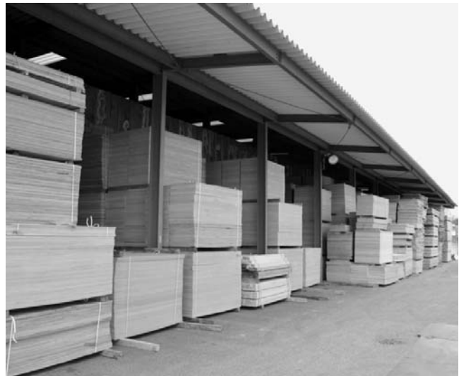
建設現場の最高のパートナーを目指す

現在では建材メーカーから製品の売り込みがあるなど、業界内で注目される存在だ。また、養生ベニヤを再生活用する循環も確立。使用済みのベニヤを引き取り、再生して品質をランク分けし、適したユーザーに販売する。「有料で処分していた工業者も、安価な再生品になることが目標だ。」