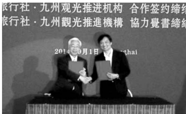
九州観光推進機構は中国の旅行会社28社とMOUを締結した

九州観光推進機構も海外からの誘客活動をさらに強化する方針だ。2023年に九州への外国人入国者数440万人という目標を掲げる。14年の167万人の2倍以上となる数字で、「現状の空路と海路を満席にしても困難な数字」(同)となる。空路の増便なども働きかけ、温泉など九州の魅力