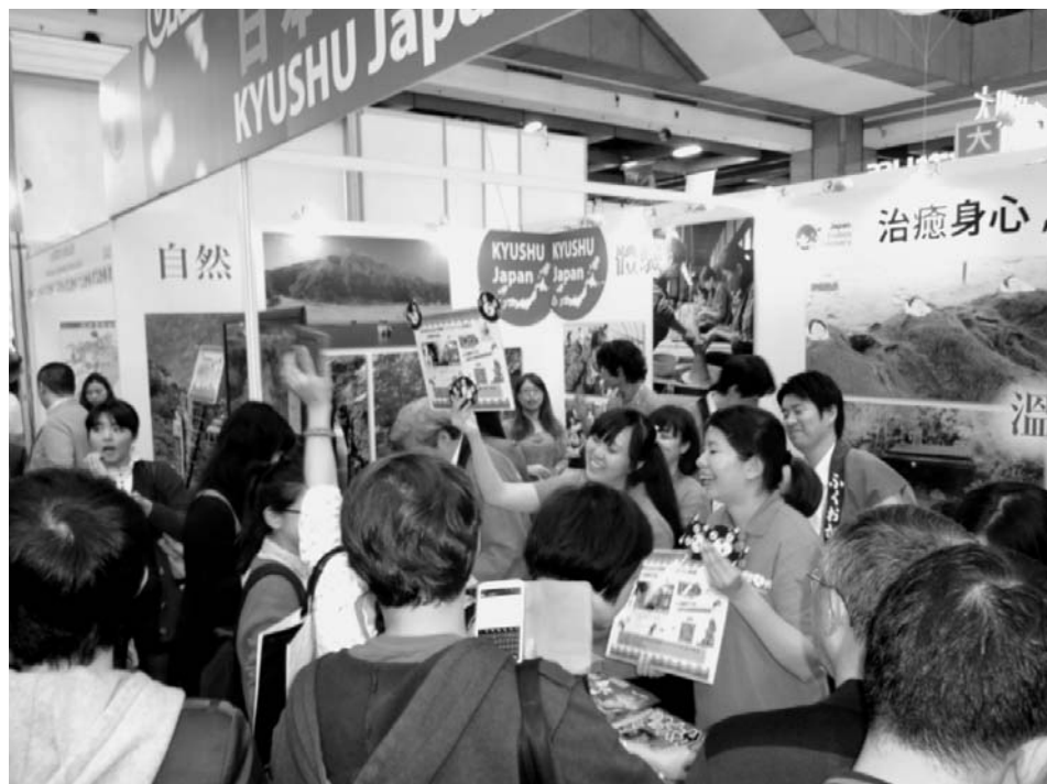
九州観光推進機構は台北国際旅行博で魅力をPR

日本を訪れる外国人観光客が急増している。2014年の外国人入国者数は前年比29.4%増え、1300万人を突破した。九州への入国者数も同33.3%増え、過去最高の167万人を記録。従来の団体ツアーだけでなく、近年は個人旅行で日本を訪れる人も増え、海外旅行客のニーズも多様化している。九州では九州観光推進機構(福岡市中央区)が団体ツアー向け、個人向けと国ごとに発信する情報を変え、海外からの誘客に取り組んでいる。さらに「明治日本の産業革命遺産 九州・山口と関連地域」が世界遺産リストへの登録へ向け審査が進められている。同リストに登録されれば九州の新たな観光資源として注目されそうだ。