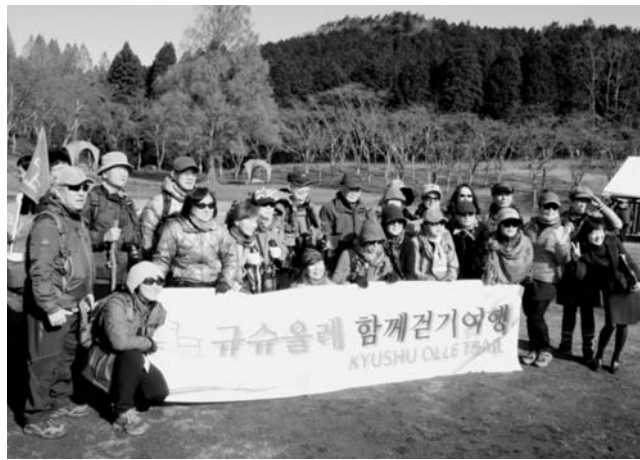
九州の自然を巡る「九州オルレ」は韓国人に好評

九州観光推進機構も海外からの誘客活動をさらに強化する方針だ。2023年に九州への外国人入国者数440万人という目標を掲げる。14年の167万人の2倍以上となる数字で、「現状の空路と海路を満席にしても困難な数字」(同)となる。空路の増便なども働きかけ、温泉など九州の魅力