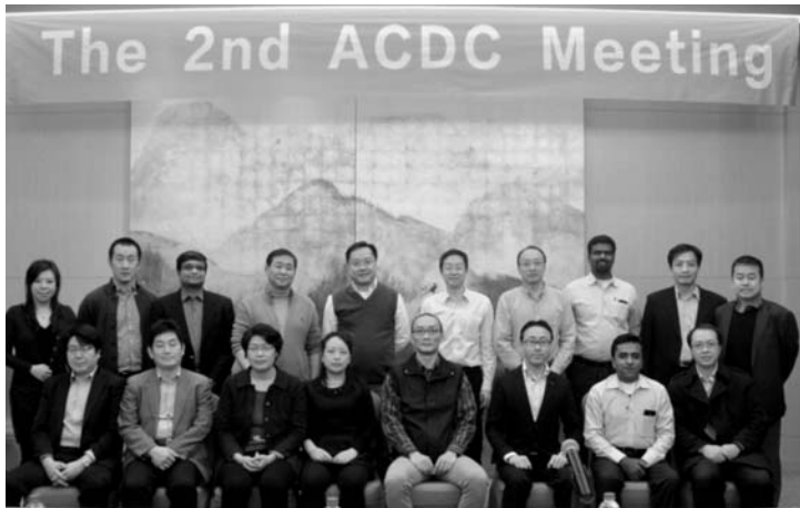
第2回アジアカッパーダイカスティングコンフェデレーション