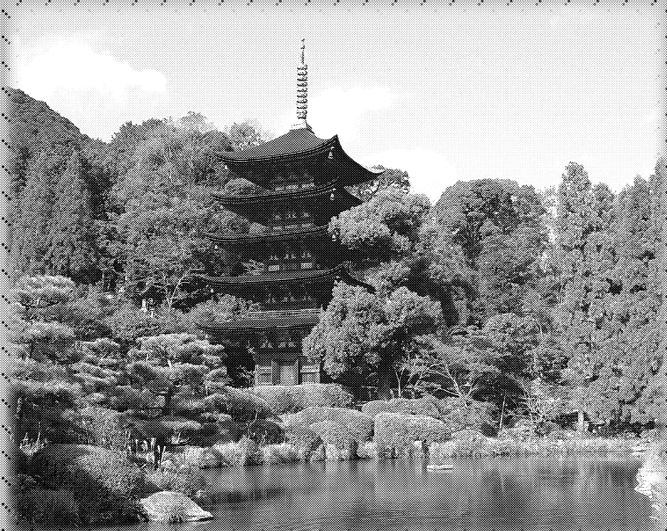
国宝 瑠璃光寺五重塔