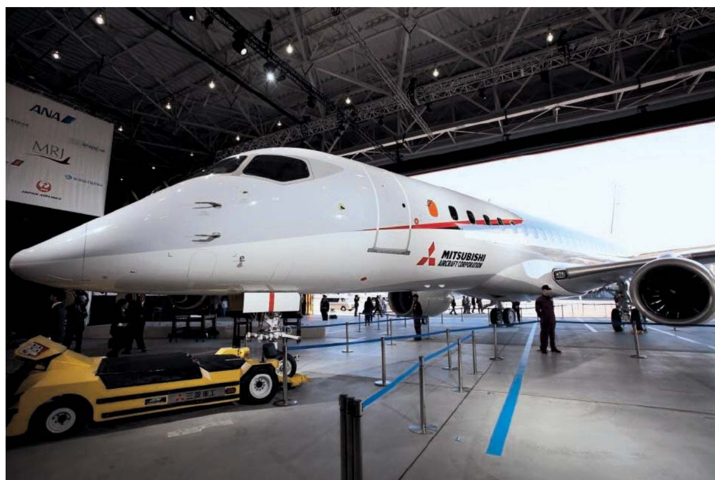
半世紀ぶりの国産旅客機「MRJ」 がロールアウト(完成披露)