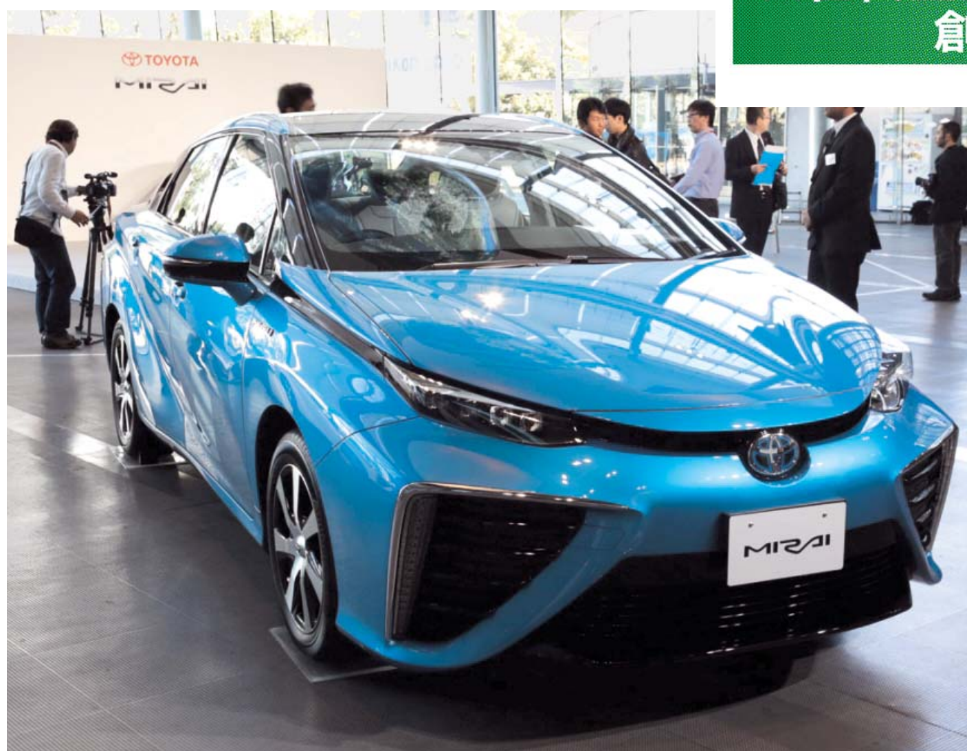
次世代エコカーの本命とされる燃料電池車 (FCV、トヨタ自動車「MIRAI(ミライ)」)