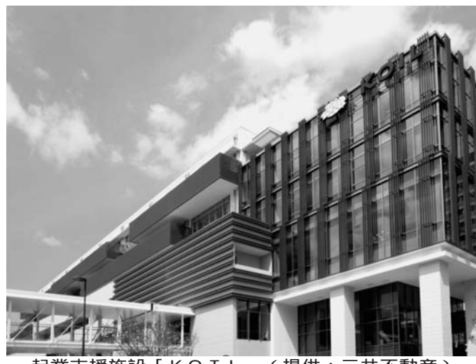
起業支援施設「KOIL」

新産業創出のターゲットは日本だけに止まらない。7月15日に、ゲートスクエアで「アジア・アントレプレナーシップ・アワード(AEA)2014」が開催された。アジアの若き起業家たちが一 新産業創出のターゲットは日本だけに止まらない。7月15日に、ゲートスクエアで「アジア・アントレプレナーシップ・アワード(AEA)2014」が開催された。アジアの若き起業家たちが一