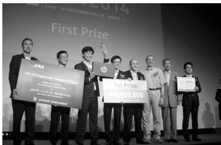
アワード開催でアジアのベンチャーを呼び込む