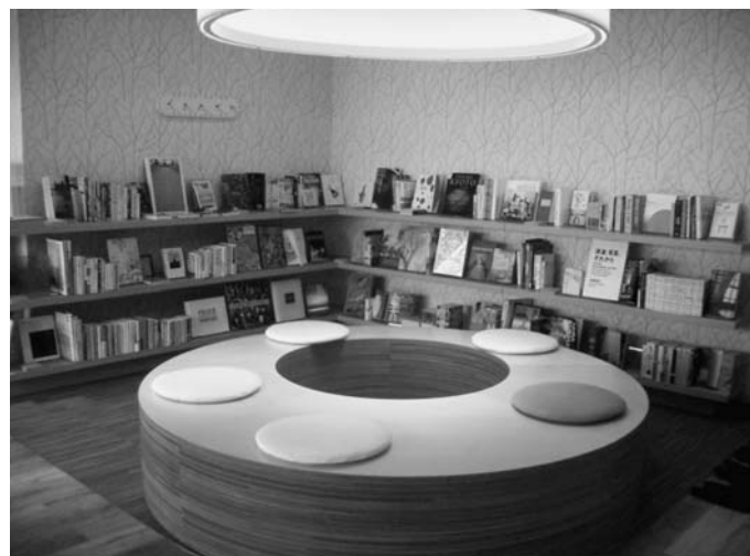
あらゆる人材が交流する場、仕掛けを設ける

スは、会員登録数が約100人となるなど順調に数を増やしている。10室あるインキュベーションオフィスも、年内には満室となる見込みだ。KOILの特徴は、ベンチャー企業や起業家、起業志望者のみが集まる通常のインキュベーション施設と異なり、周辺の大学生や研究者、大企業、地元住民などさまざまな人材が集う施設だということ。KOIL側が異色の人材が交流する仕掛けをすることで、イノベーションや課題解決のヒントが生まれる。 施設内には創業支援を手がけるTXアントレプレナーパートナーズ(TEP)も入居。投資家や弁護士、起業経験のある専門家が、創業に向けた資金や営業戦略などの経営課題を支援する。