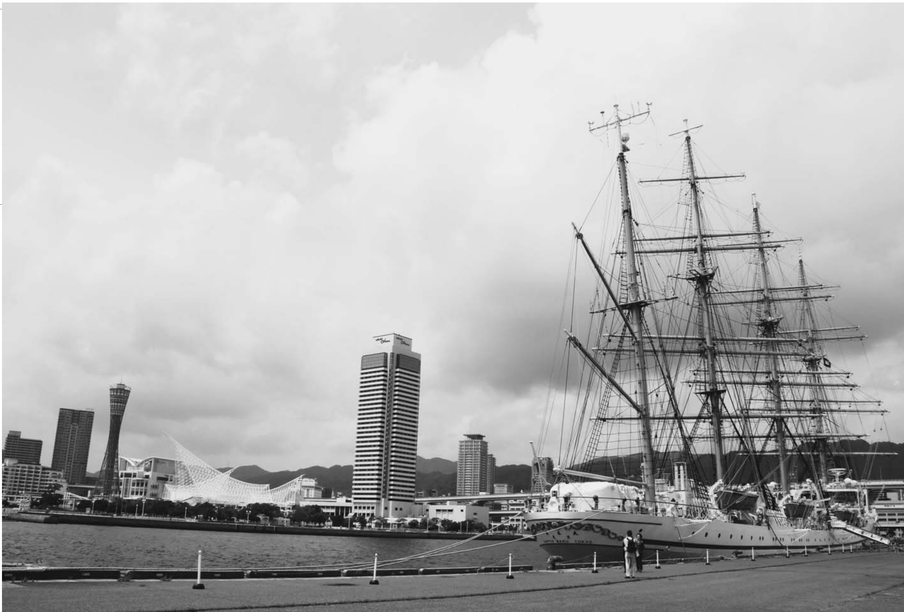
神戸港の新港第一突堤から望むメリケンパーク周辺。手前に停泊するのは航海訓練所（横浜市中区）の練習船「日本丸」。

アベノミクスの成長戦略の一つ、航空・宇宙分野では、13年に中小企業9社で始めた航空機メーカー参入プロジェクトですでに3社が今夏までに新規参入を決めた。医療分野でも9月には「滲出型加齢黄斑変性に対する自家iPS細胞由来網膜色素上皮シート移植に関する臨床研究」で第一症例目の移植手術が先端医療センター病院で実施され、無事終了した。農業分野で国家戦略特区に指定された養父市で農地の権利移動の許可事務の市への移譲が決定し、一歩前進した。姫路市は総務省の地方中枢都市制度のモデル都市に関西で唯一選ばれ、持続的成長に向けた歩みを始めた。来年は阪神・淡路大震災から20年。節目の年に飛躍を目指す羽ばたきが兵庫・神戸のあちこちから聞こえている。