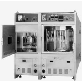
カーボン・キセノン一灯型

スガ試験機 (東京都新宿区) は、素材の耐腐蝕性や耐腐食性などを測定する環境試験機のほか、色彩測定機器などを手がけている。中でも国際規格規定の光源による「促進耐候性試験機」の全機種を自社開発し、カーボンアーク光源試験機は世界シェア100%を誇る。須賀茂雄社長は「ライオンアップが強い、お客さまに総合的な提案ができる」と胸を張る。