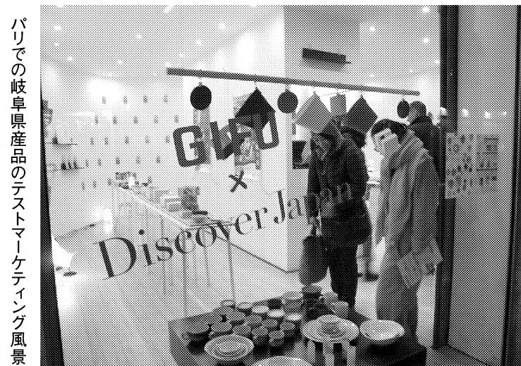
パリの岐阜県産品のテストマーケティング風景

岐阜大学は「地域に根ざし、学び、究め、貢献する人材を育てる」という基本方針を掲げている。 機構改革、教員教育の充実、外部資金の活用、国際化などを掲げた2010～15年度の第2次中期計画に取り組んでいる。14年度は造形技術や創業の分野で学外との連携拡充も計画している。 校は国際化の一環として、地域科学部に海外からの留学生専用コース「国際教養コース」を2016年度に新設する。英語のみで授業をし、日本語や日本の文化・社会に関する講座も充実して